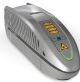
CO Two Marker