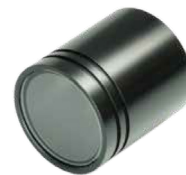
VISOR®용 C 마운트 보호 하우징