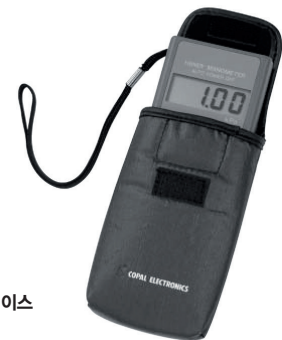
PG-100용 휴대용 소프트 케이스