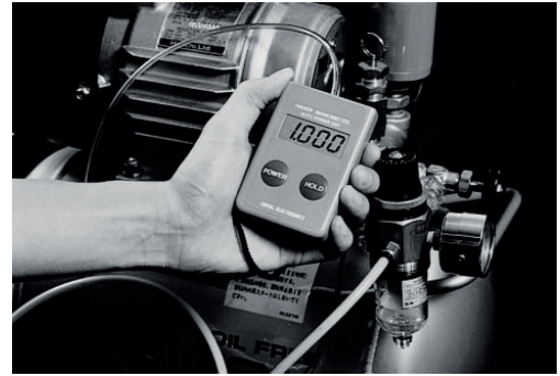
▲ 압축기로부터 발생하는 압력원 측정